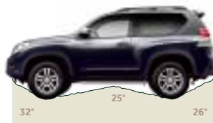
Kąty natarcia, rampowy i zejścia